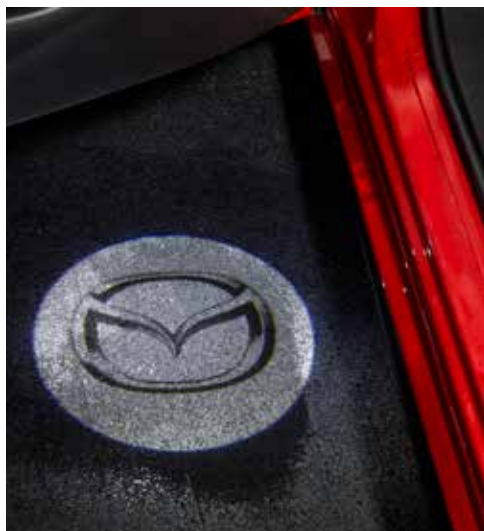
Mazda LED Logo Projector