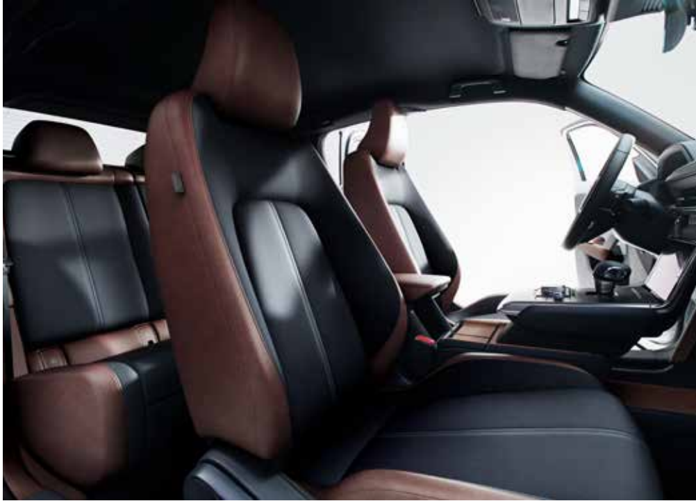
Interieurthema 'Industrial Vintage'