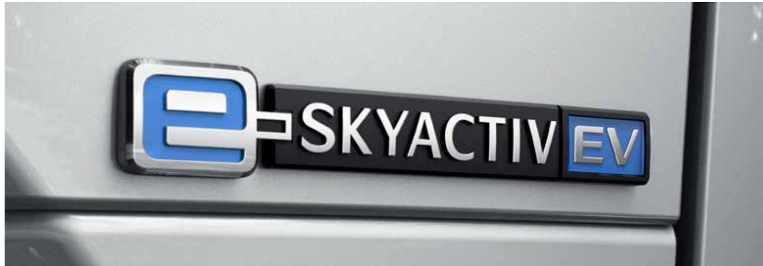
Mazda MX-30 e-SKYACTIV 145 pk