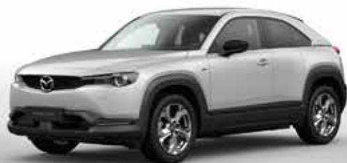
CERAMIC WHITE (47A)**