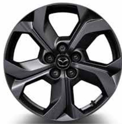
18" 'Bright' lichtmetalen velgen met 215/55 R18 banden (MAKOTO)