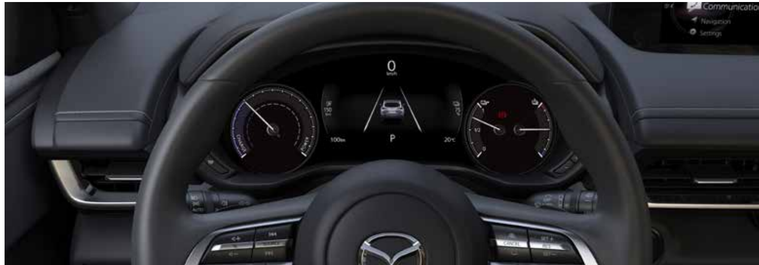
Tellers met 7" TFT kleurscherm