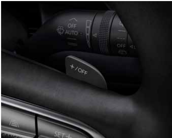
Schakelpeddel achter het stuurwiel voor instelling regeneratief remmen