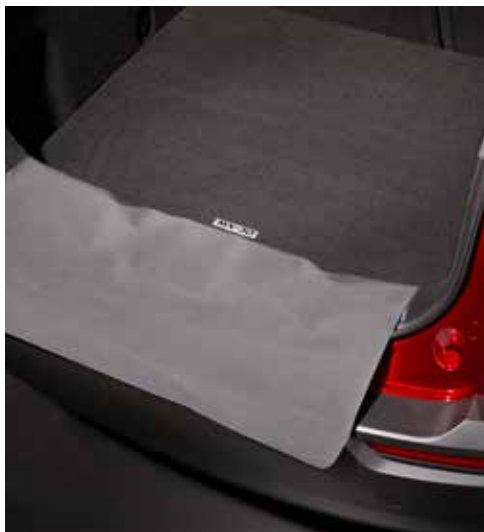
Koffermat met achterbumperbescherming