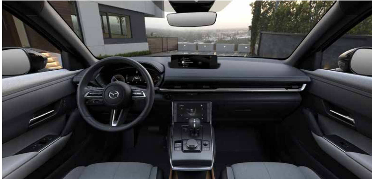
Interieurthema 'Standaard': zetelbekleding in zwart/grijs stof, zwarte dakhemel, zwevende middenconsole met twee bekerhouders, opbergruimte onder de armsteun en inleg in natuurlijk gekleurde kurk, lederen stuurwiel en versnellingspookknop