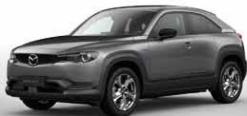
MACHINE GREY (46G)**