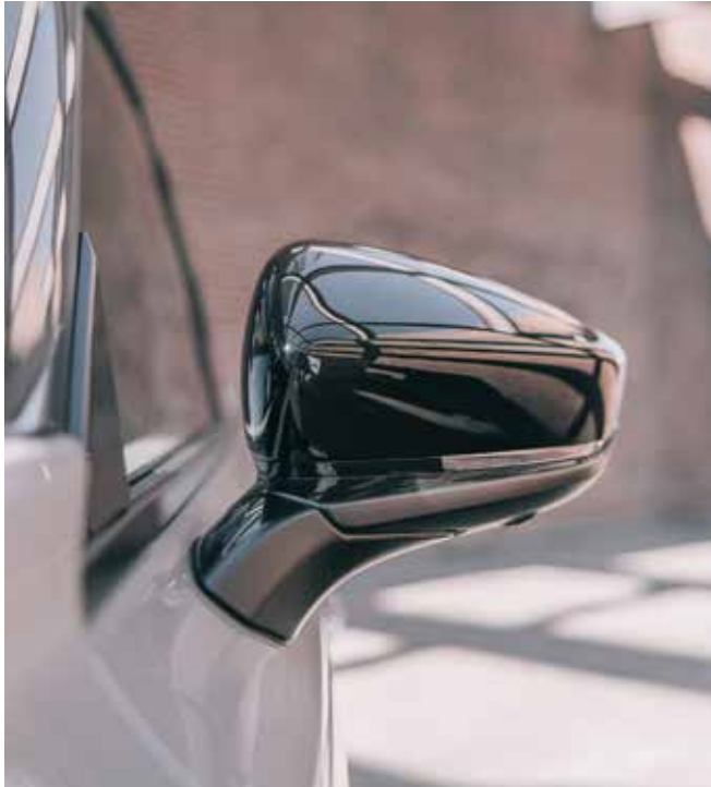
Elektrisch verstelbare buitenspiegels in 'Piano Black'