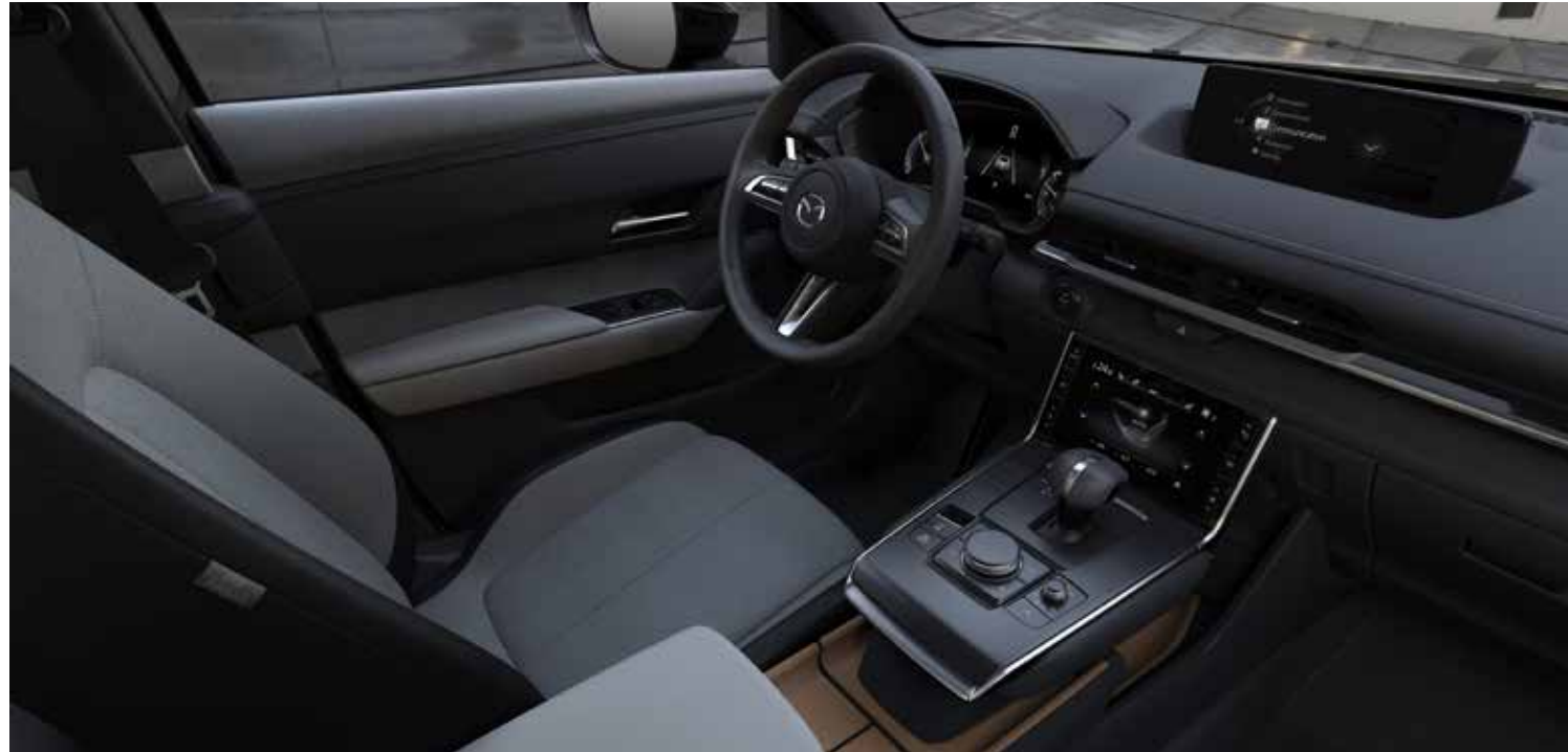
Interieurthema 'Standaard': zetelbekleding in zwart/grijs stof, zwarte dakhemel, zwevende middenconsole met twee bekerhouders, opbergruimte onder de armsteun en inleg in natuurlijk gekleurde kurk, lederen stuurwiel en versnellingspookknop