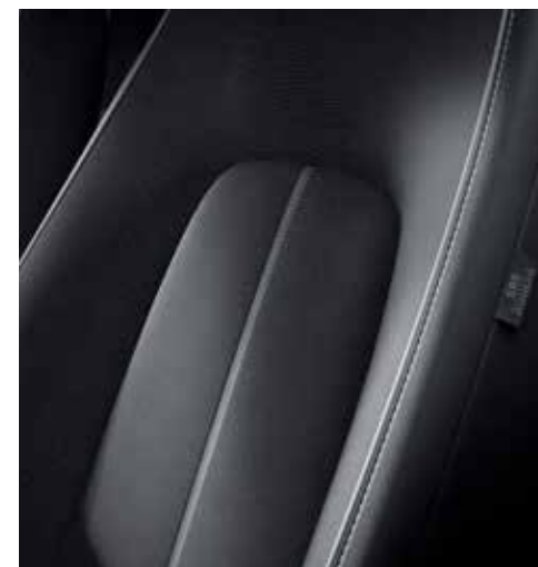
Interieurthema 'Urban Expression' (Keuze op MAKOTO)