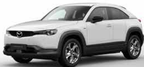
ARCTIC WHITE (A4D)