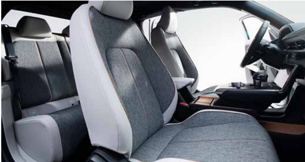
Interieurthema 'Modern Confidence'