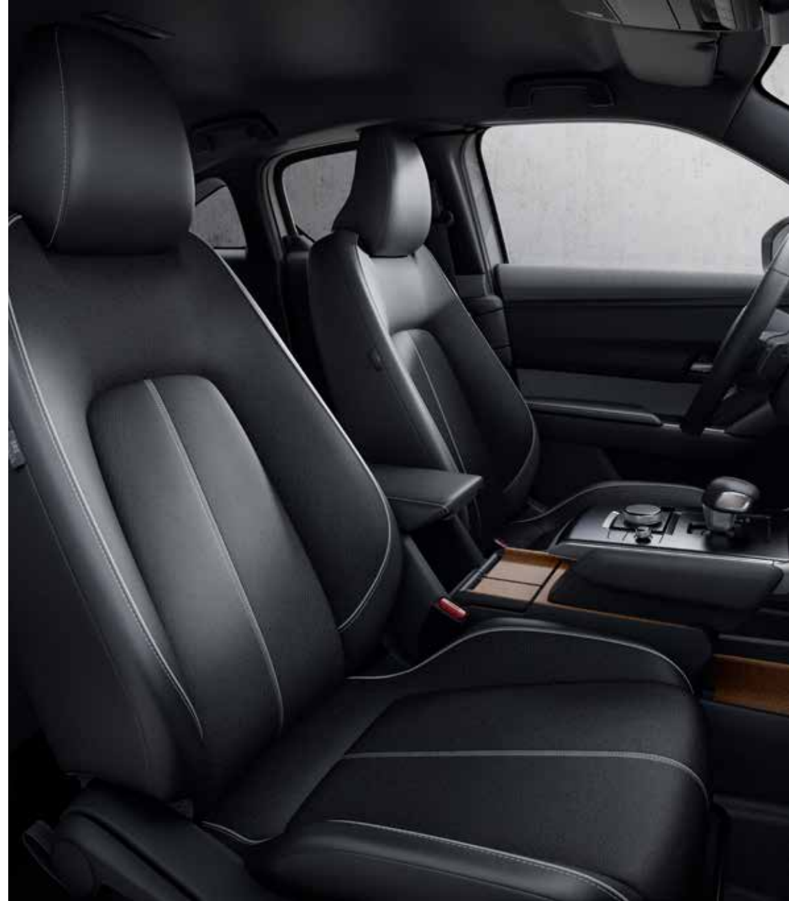
Interieurthema 'Urban Expression'