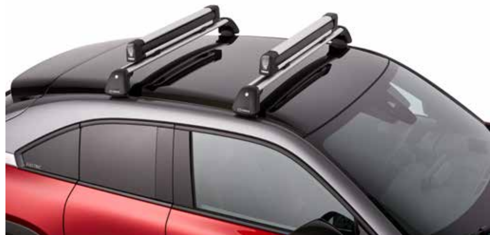
Ski -en snowboarddrager (lang)