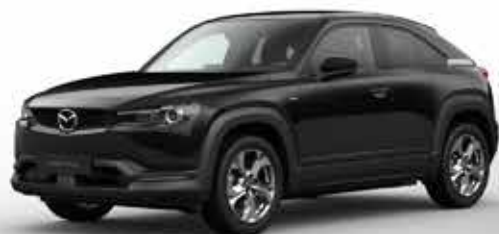
JET BLACK (41W)**