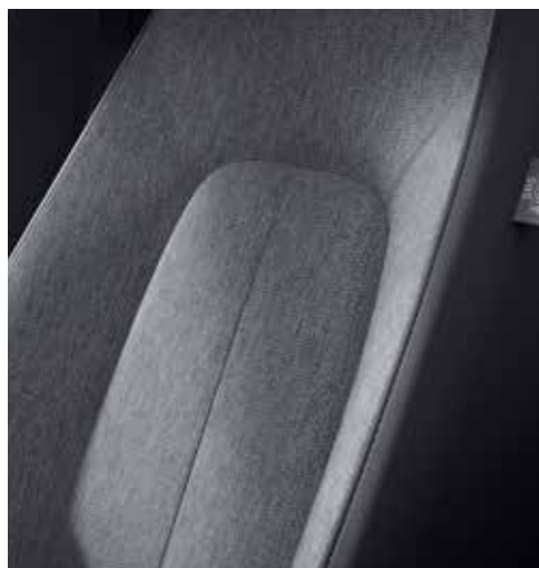
Interieurthema 'Standaard' (PRIME-LINE & EXCLUSIVE-LINE)