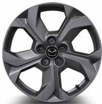
18" 'Silver' lichtmetalen velgen met 215/55 R18 banden (PRIME-LINE & EXCLUSIVE-LINE)