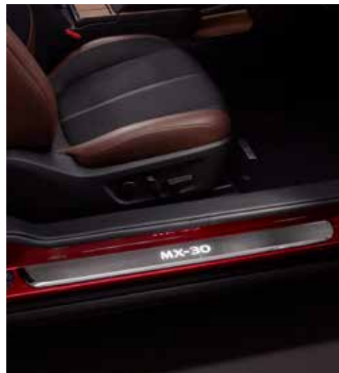
Drempelbeschermers verlicht MX-30 logo