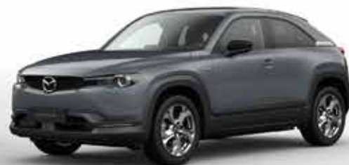
POLYMETAL GREY (47C)**