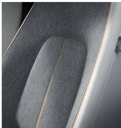
Interieurthema 'Modern Confidence' (Keuze op MAKOTO)