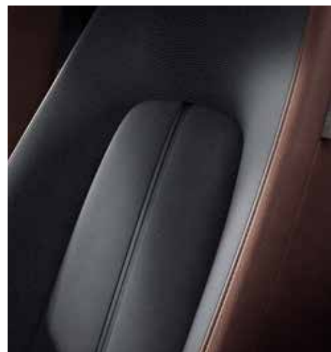
Interieurthema 'Industrial Vintage' (Keuze op MAKOTO)