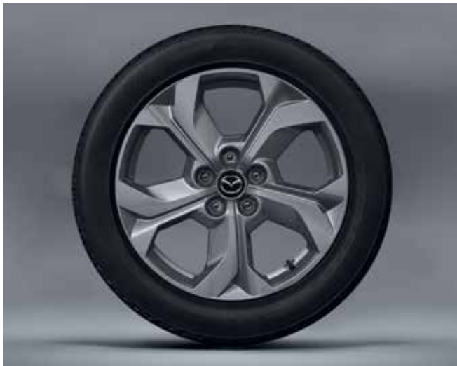
18" 'Silver' lichtmetalen velgen met 215/55 R18 banden