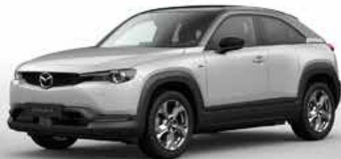
CERAMIC WHITE 3-tons (48A)***