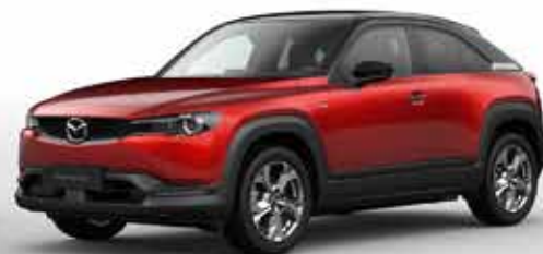
SOUL RED CRYSTAL 2-tons (49V)***