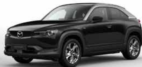
JET BLACK 2-tons (49P)***