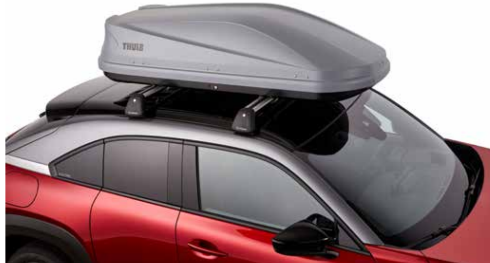
Dakkoffer (Thule Touring 200)