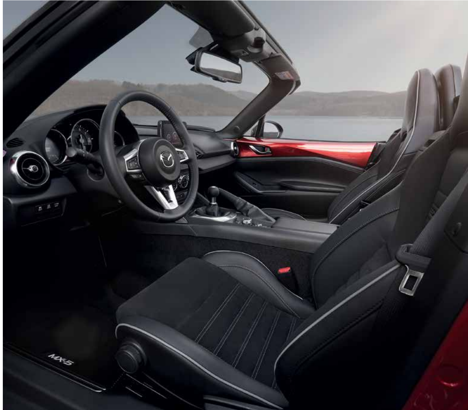
Sièges Recaro® avec revêtement en cuir noir, Alcantara® noir, surpiqûres 'Silver' et passepoil gris