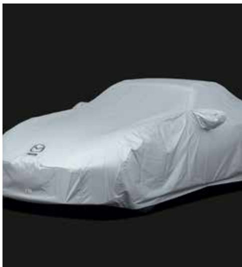
Housse complète de protection de voiture extérieure