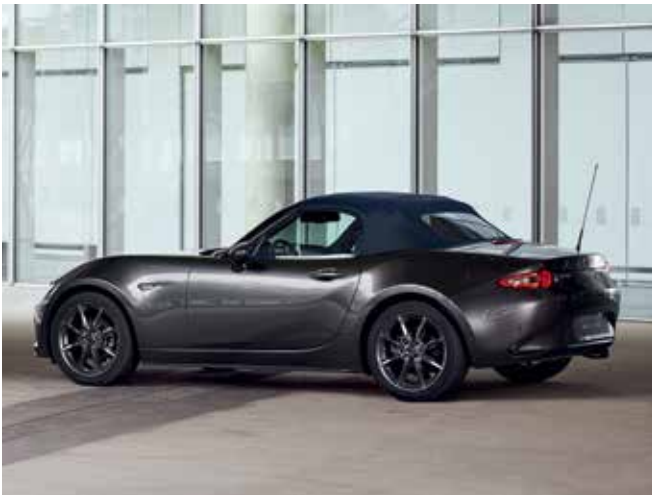
Capote bleu (uniquement sur la Roadster)