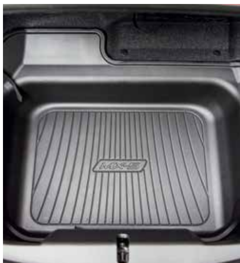
Protection de coffre