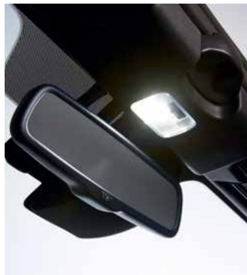
Éclairage intérieur LED