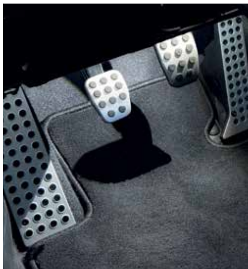
Éclairage d'embarquement (LED)