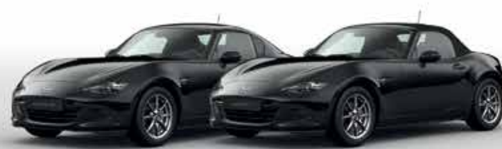
JET BLACK (41W)*