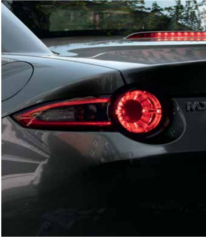
Phares arrières LED