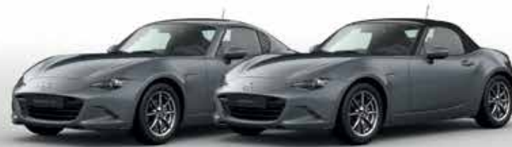
POLYMETAL GREY (47C)*