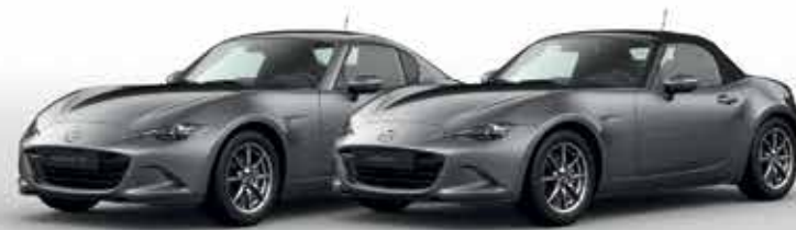
MACHINE GREY (46G)*