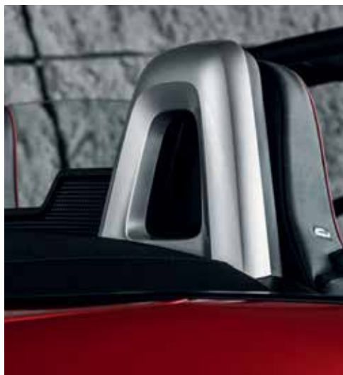
Coques de rétroviseur argenté, revêtement fashion bar argenté, garniture de montant avant argenté (Roadster)