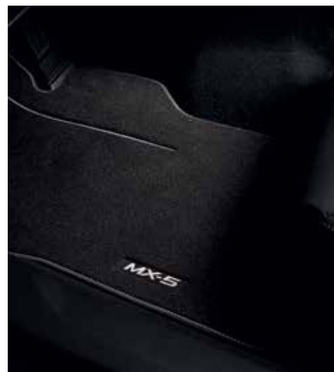
Tapis de sol « Luxe »