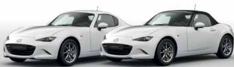
ARCTIC WHITE (A4D)