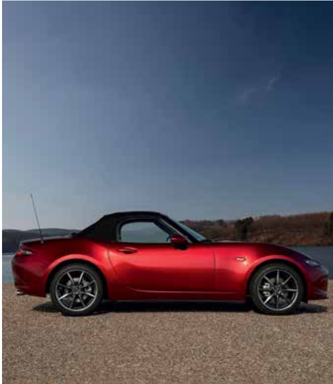
Capote noir (uniquement sur la Roadster)