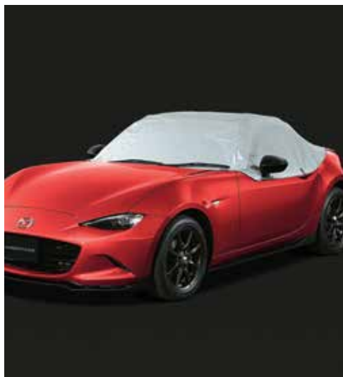
Demi-housse de protection de voiture extérieure (Roadster)