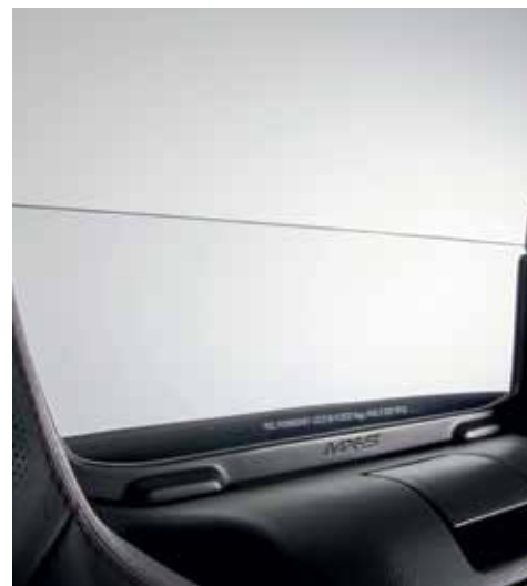
Saut de vent transparent (Roadster)