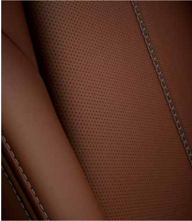
Revêtement des sièges en cuir Nappa Terracotta avec surpiqûres 'Silver'