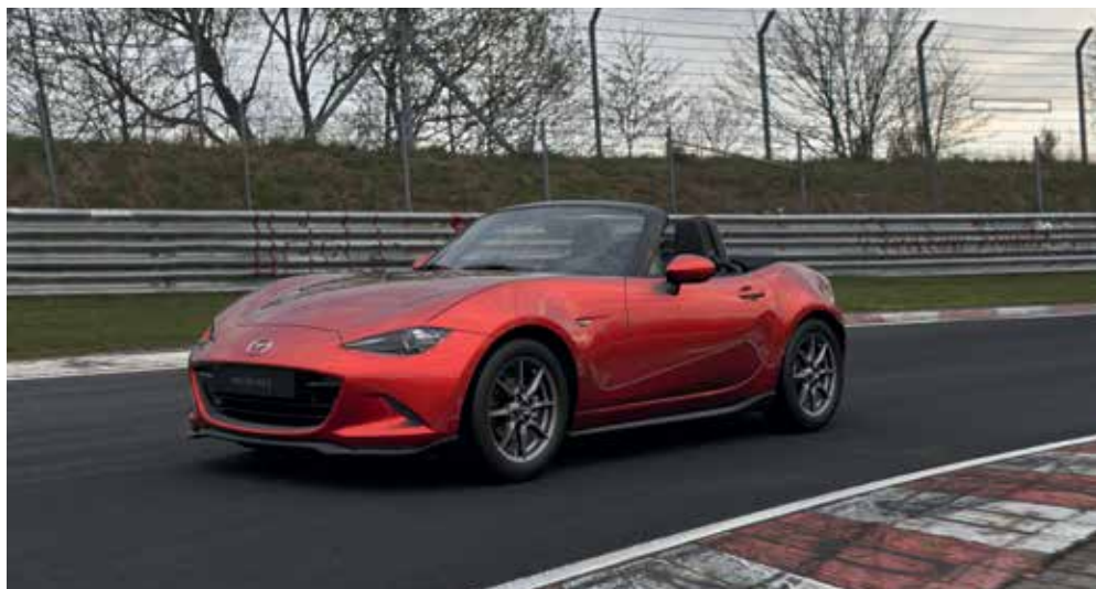
Jupes latérales, aileron de coffre, jupe avant, jupe de bouclier arrière