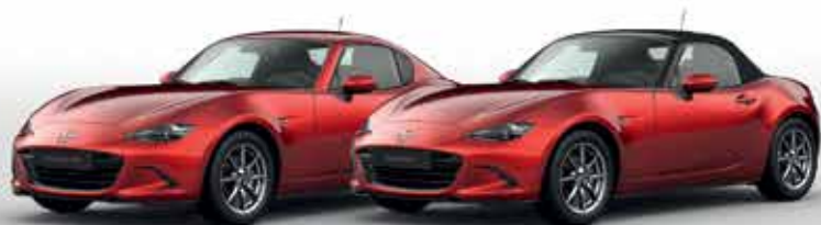
SOUL RED CRYSTAL (46V)*