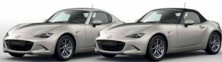
PLATINUM QUARTZ (47S)*