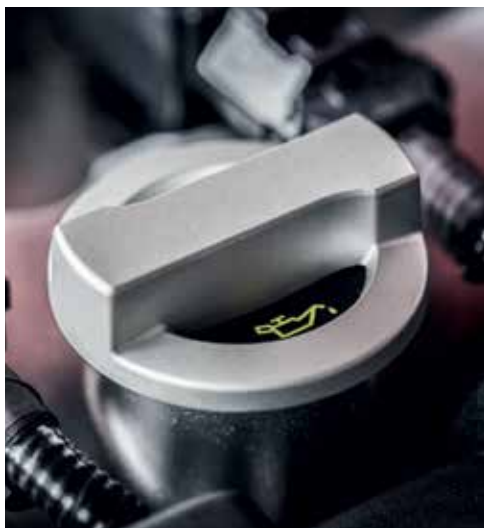
Bouchon de remplissage d'huile (argent)