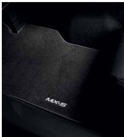
Tapis de sol « Standard »