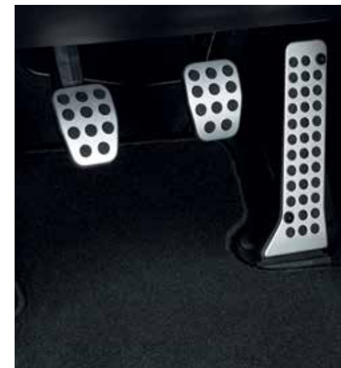
Pédales en aluminium