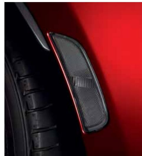
Réflecteurs latéraux (gris)