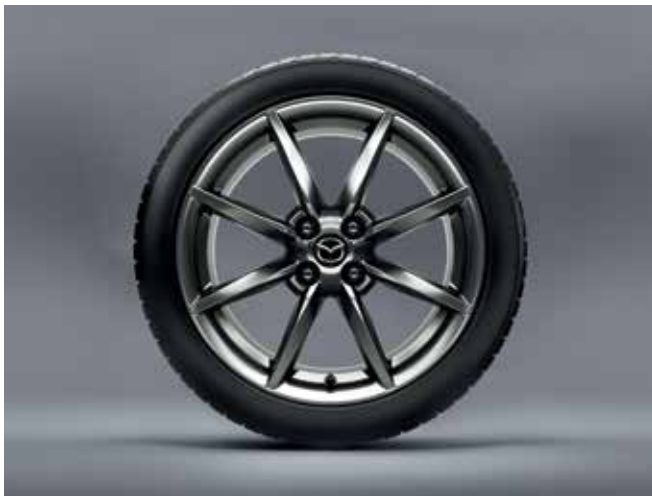
Jantes en alliage 'Bright Dark' 17" avec pneus 205/45 R17