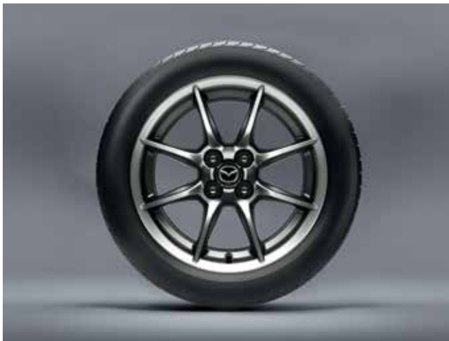
Jantes en alliage 'Bright Dark' 16" avec pneus 195/50 R16 (uniquement sur SKYACTIV-G 132 ch)