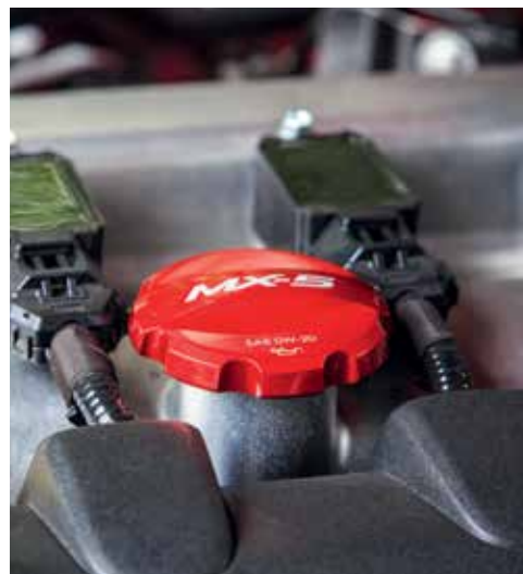
Bouchon de remplissage d'huile (rouge)