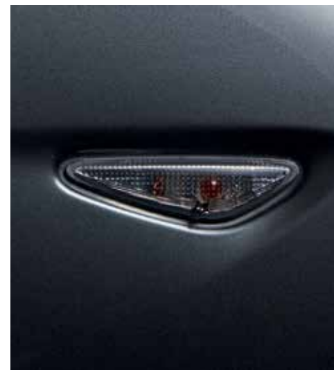
Indicateurs latéraux (verre "smoked")