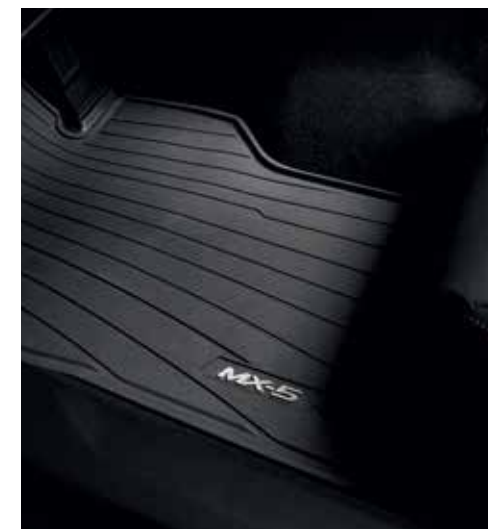
Tapis de sol « Caoutchouc »