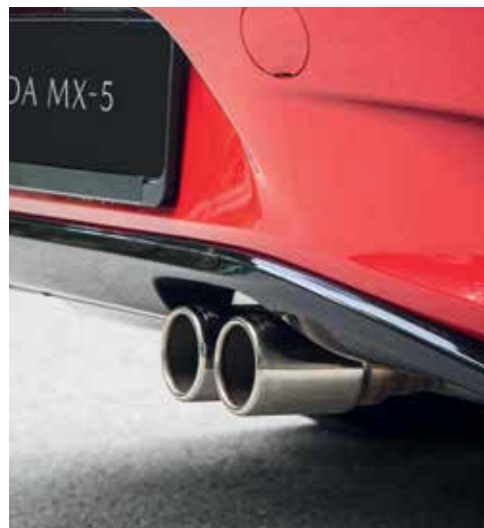
Échappement sport Bastuck