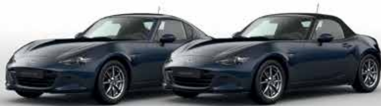
DEEP CRYSTAL BLUE (42M)*