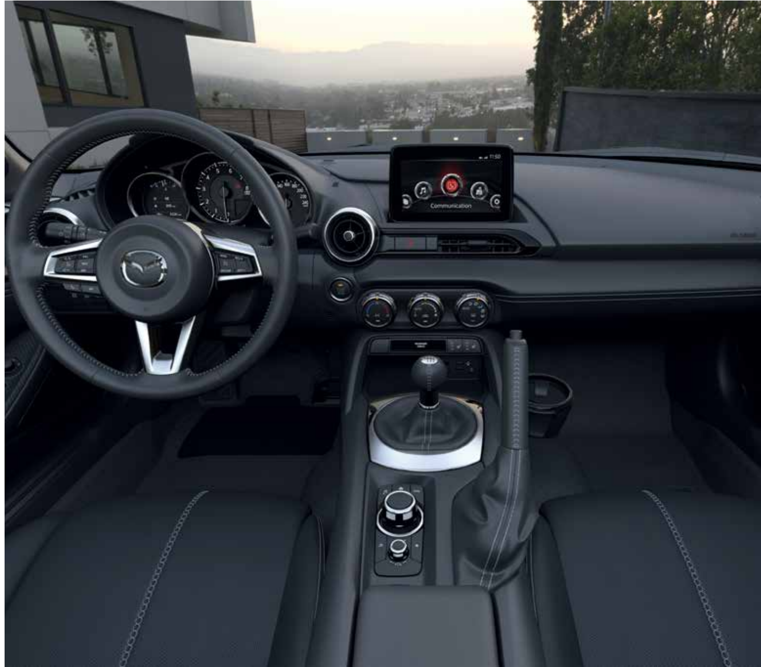
Intérieur cuir noir avec surpiqûres grises