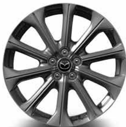
20" lichtmetalen velgen 'Design A Silver' met bandenmaat 235/50R20 (EXCLUSIVE-LINE)