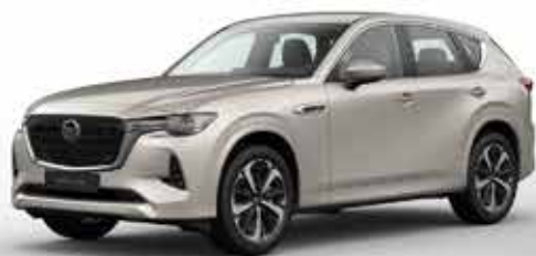
PLATINUM QUARTZ (47S)*