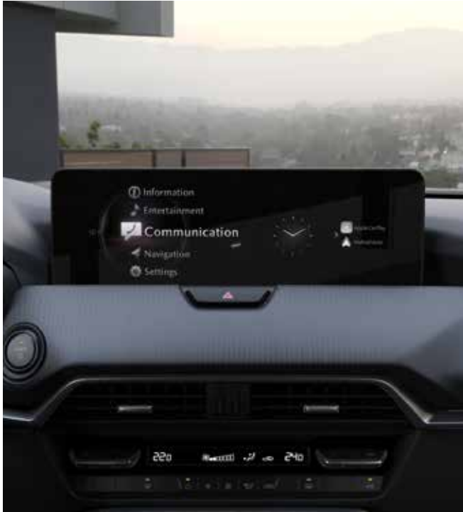
12,3" TFT kleurenscherm