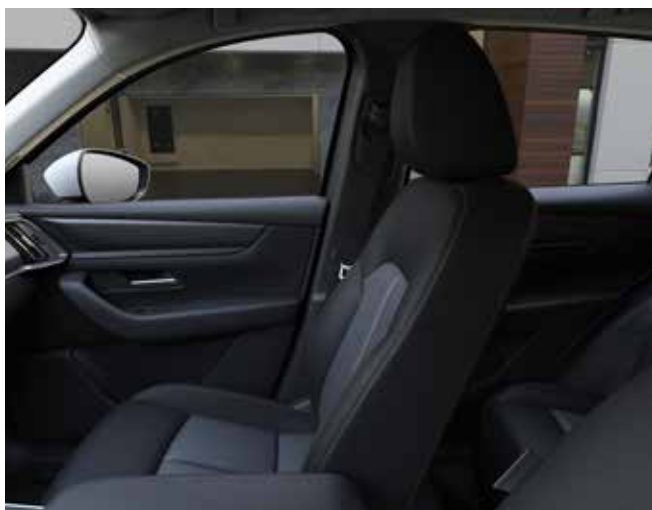
Zetelbekleding in zwarte stof met contrasterende stiknaad (PRIME-LINE, EXCLUSIVE-LINE)