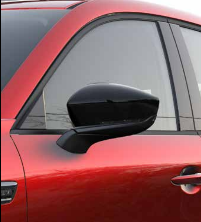
Elektrisch verstelbare, verwarmde en automatisch inklapbare buitenspiegels in 'Piano Black'