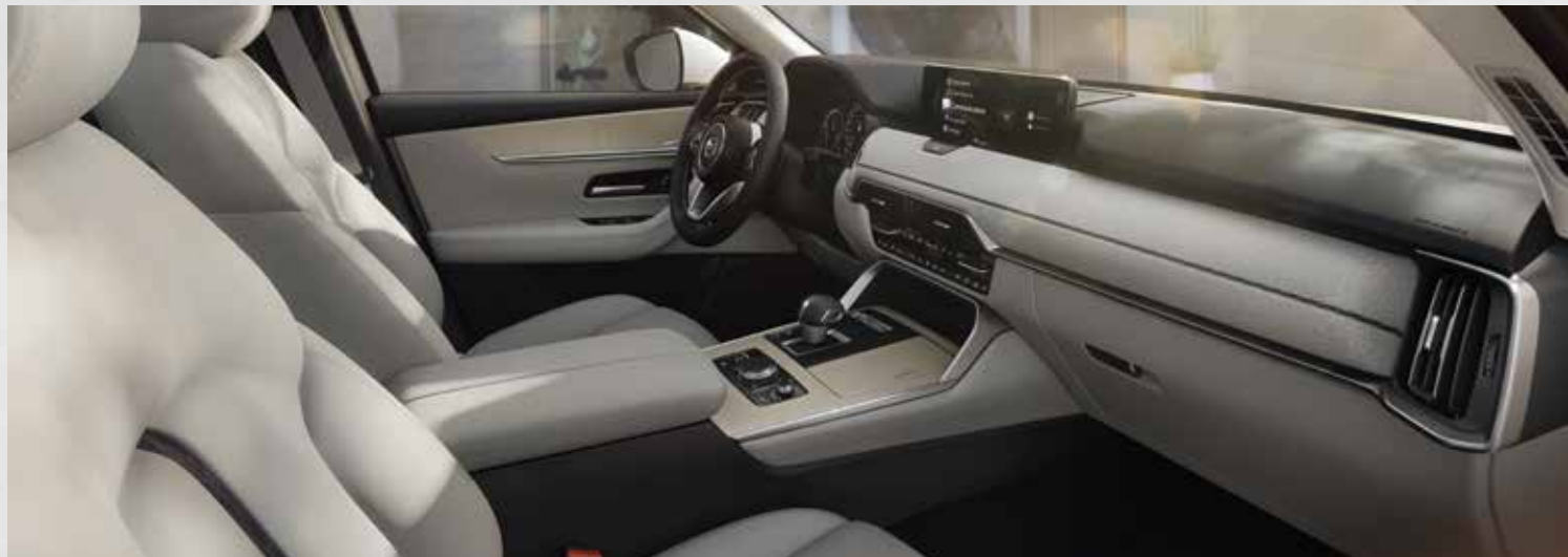
Interieur: wit Nappa lederen zetelbekleding met contrasterende stiknaad en zwarte middenstreep, inleg vloerconsole, armsteun en armsteun deurpanelen in wit kunstleder met contrasterende stiknaad, inleg vloerconsole en deurpanelen in hout Esdoorn en bekleding deurpanelen in witte 'geweven' stof