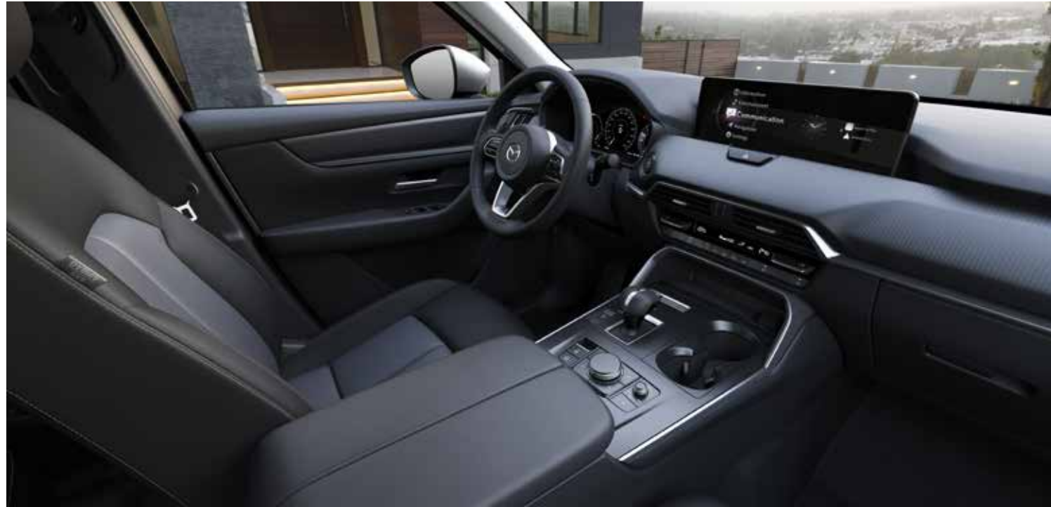
Interieur: zetelbekleding in zwarte stof met contrasterende stiknaad, bekleding vloerconsole, armsteun, armsteun deurpanelen in zwarte kunststof, inleg dashboard in gesatineerd chroom en inleg deurpanelen in zwart 'Onyx'