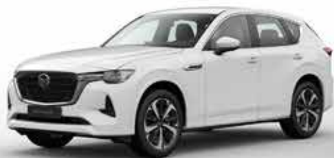
ARCTIC WHITE (A4D)