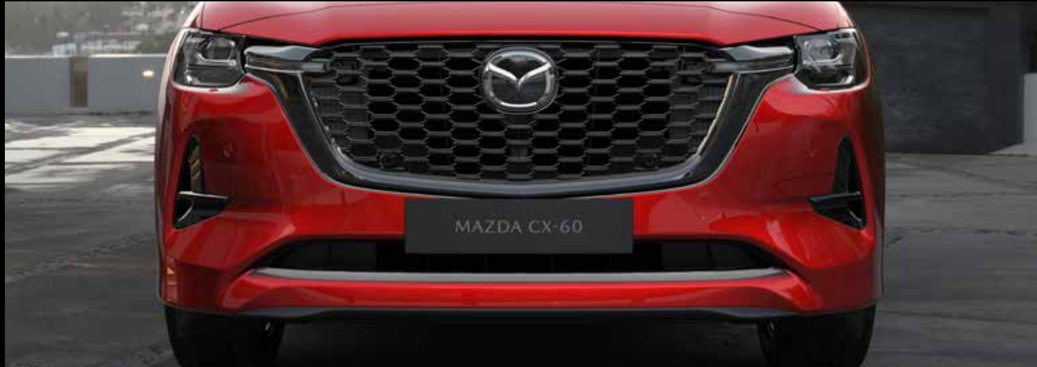
Honingraat radiatorrooster in 'Piano Black' met zwart-lijst en voorbumper in koetswerkkleur