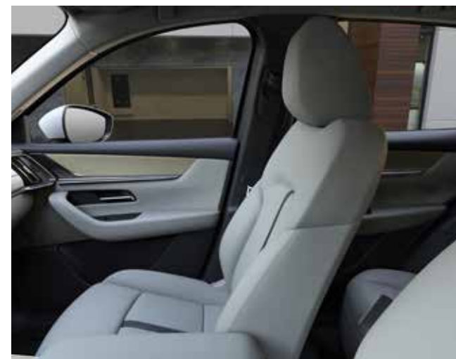
Wit Nappa lederen zetelbekleding met contrasterende stiknaad en zwarte middenstreep (TAKUMI)