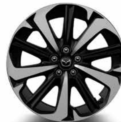
20" lichtmetalen velgen 'Design B Diamond Cut' met bandenmaat 235/50R20 (TAKUMI)