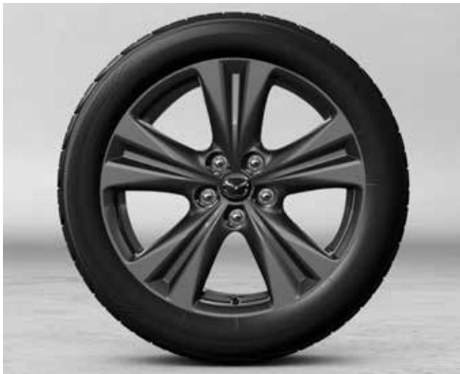
18" lichtmetalen velgen 'Grey' met bandenmaat 235/60R18