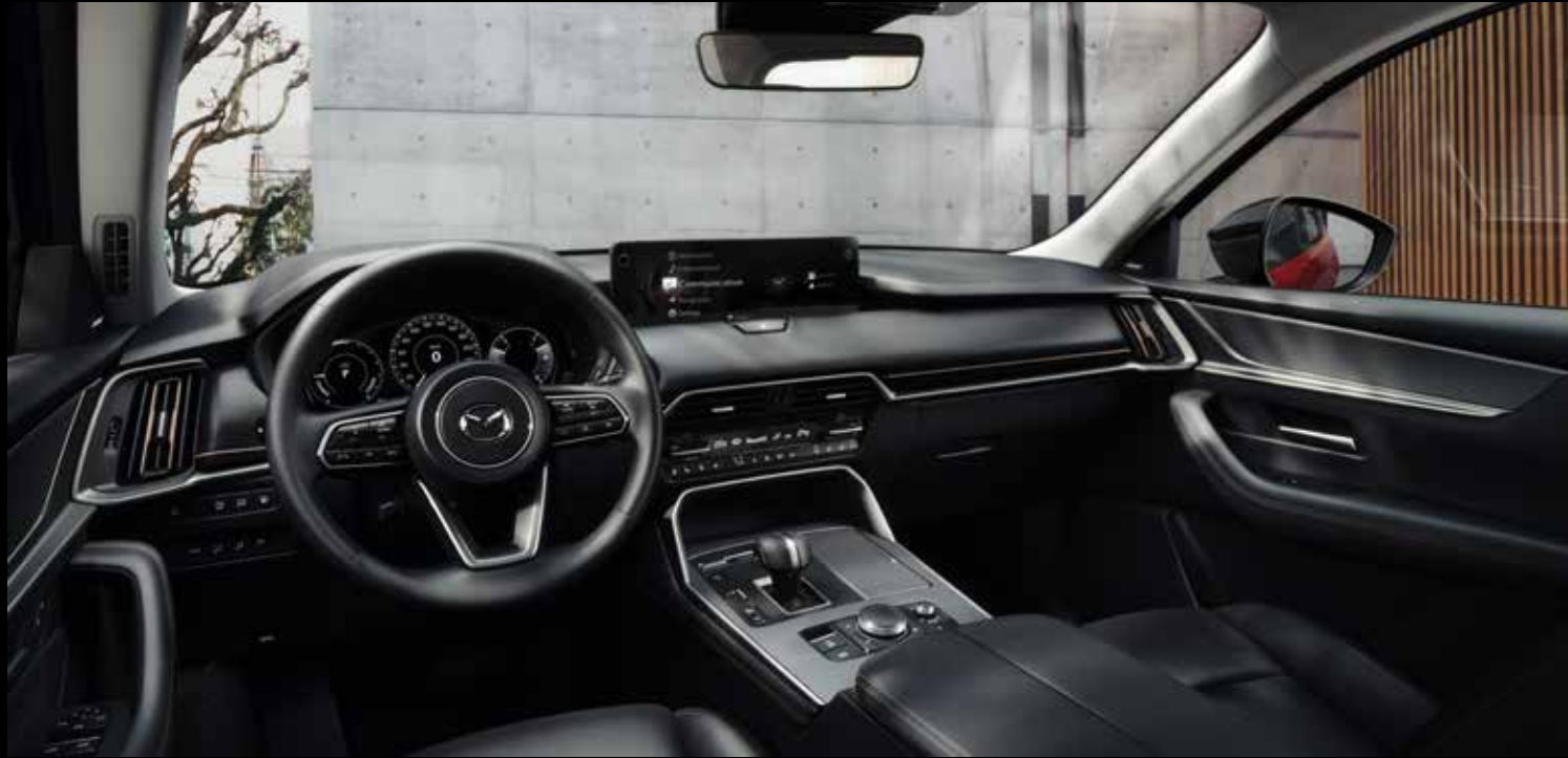
Interieur: zwart lederen zetelbekleding en contrasterende stiknaden, bekleding vloerconsole, armsteun, deurpanelen en armsteun deurpanelen in zwart kunstleder met contrasterende stiknaad en inleg vloerconsole en deurpanelen in 'Titanium'