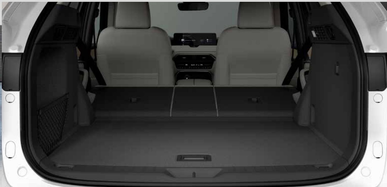
Neerklapbare achterbank 40/20/40 met Karakuri zetelsysteem