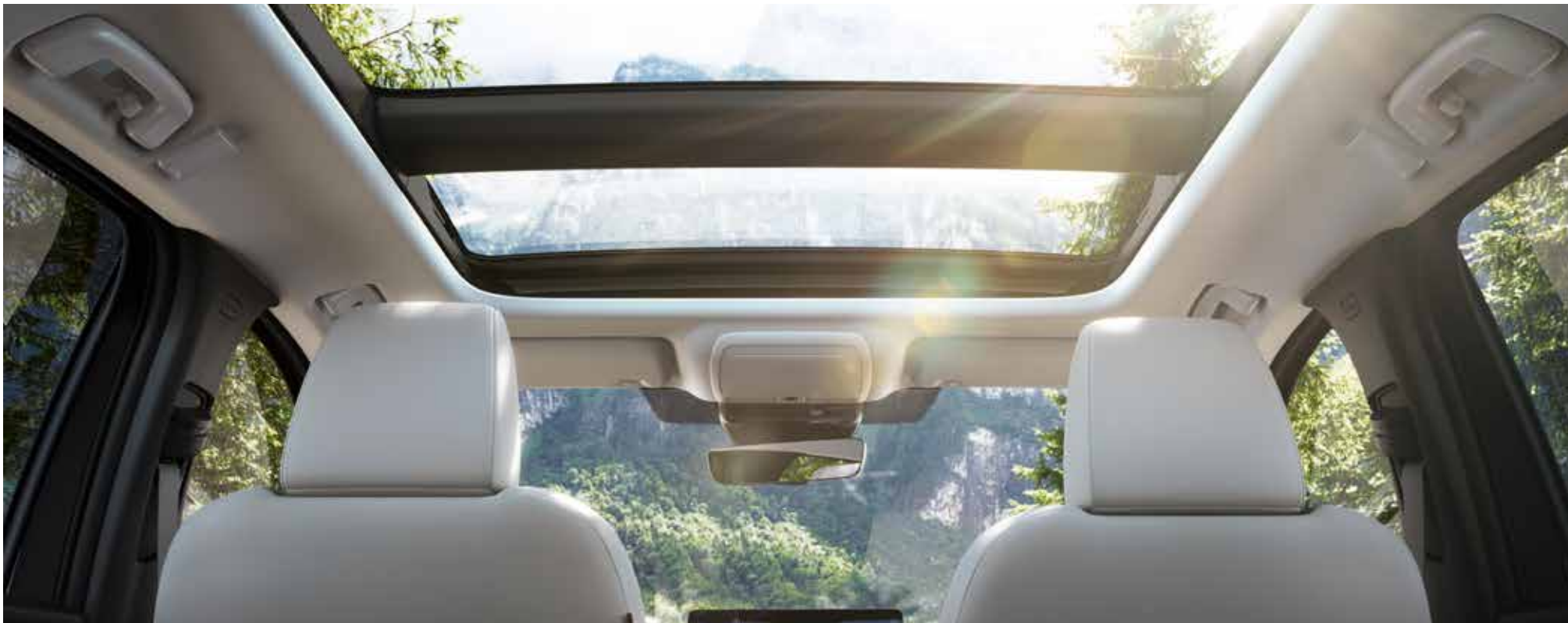
Elektrisch bediend panoramisch schuifdak