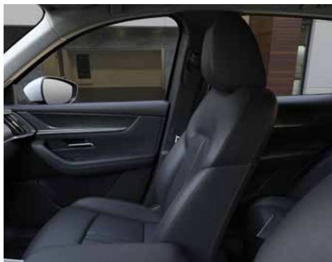
Zwart lederen zetelbekleding en contrasterende stiknaden (HOMURA, optie op EXCLUSIVE-LINE)