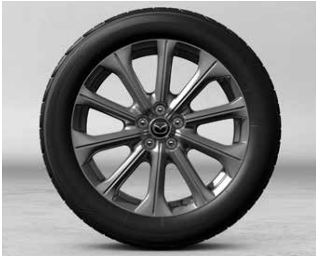
20" lichtmetalen velgen 'Design A Silver' met bandenmaat 235/50R20