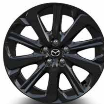
20" lichtmetalen velgen 'Black' met bandenmaat 235/50R20 (HOMURA)