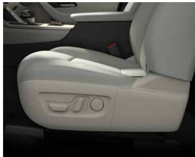
Elektrisch verstelbare bestuurders- en passagierszetel vooraan (8 richtingen + lendensteun)