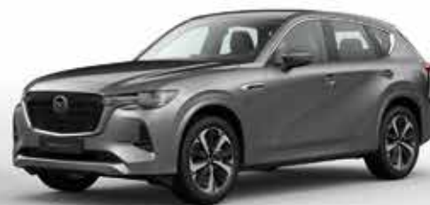
MACHINE GREY (46G)*