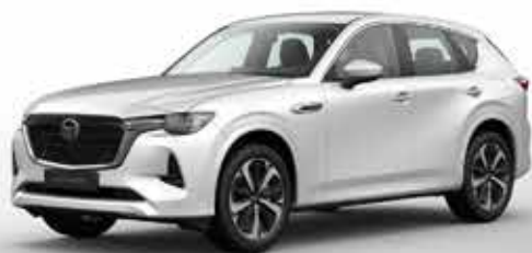
NEW: RHODIUM WHITE (51K)*