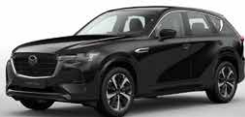
JET BLACK (41W)*