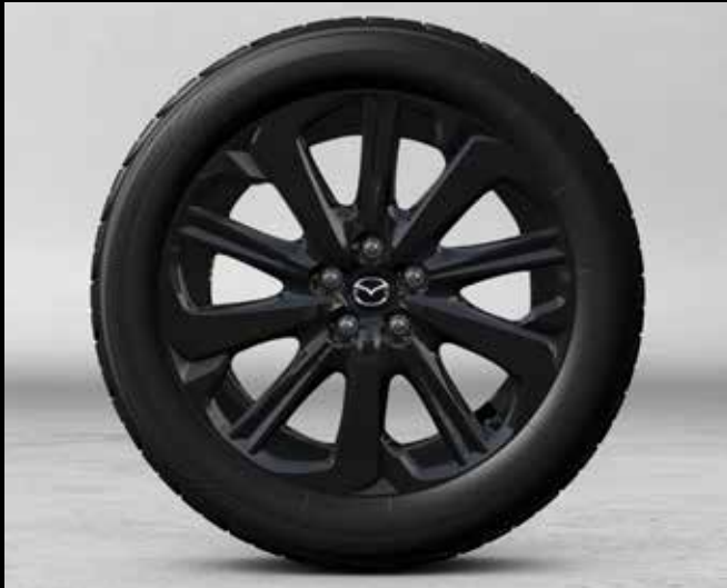
20" lichtmetalen velgen 'Black' met bandenmaat 235/50R20