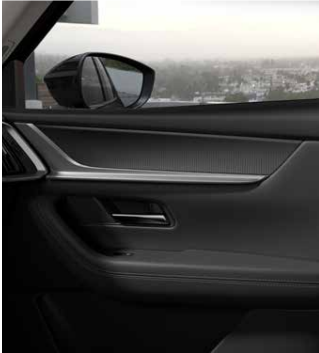
Inleg deurpanelen in 'Titanium', bekleding deurpanelen en armsteun deurpanelen in zwart kunstleder met contrasterende stiknaad