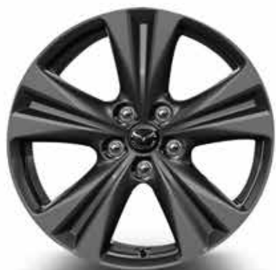
18" lichtmetalen velgen 'Grey' met bandenmaat 235/60R18 (PRIME-LINE)