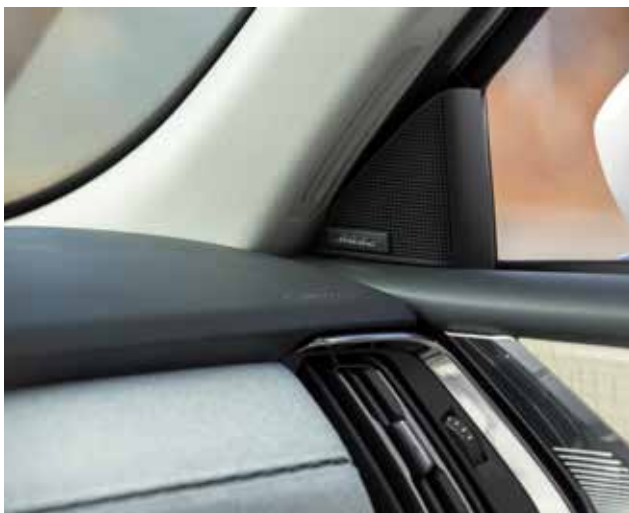
Bose® audiosysteem met 12 luidsprekers