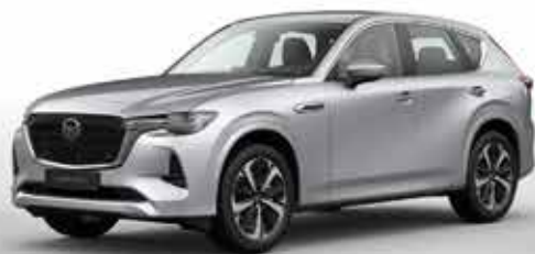
SONIC SILVER (45P)*