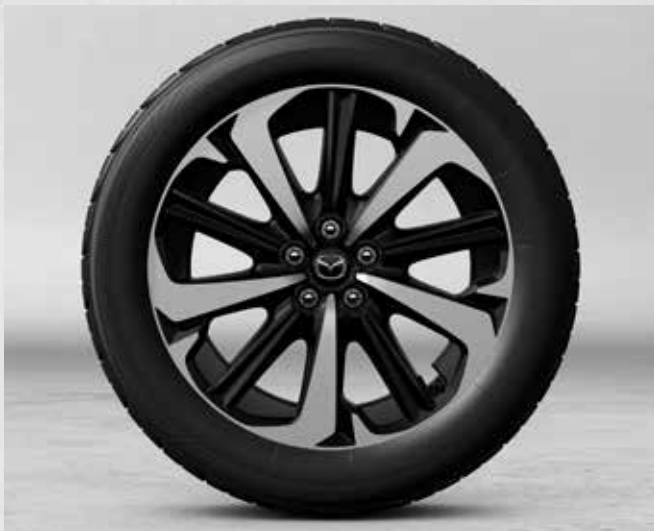
20" lichtmetalen velgen 'Design B Diamond Cut' met bandenmaat 235/50R20