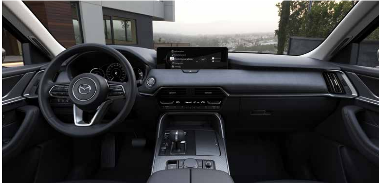
Interieur: zetelbekleding in zwarte stof met contrasterende stiknaad, bekleding vloerconsole en armsteun in zwart kunstleder met contrasterende stiknaad en inleg vloerconsole 'Titanium'