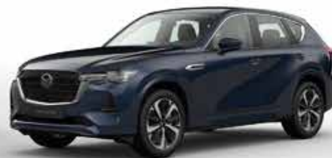
DEEP CRYSTAL BLUE (42M)*