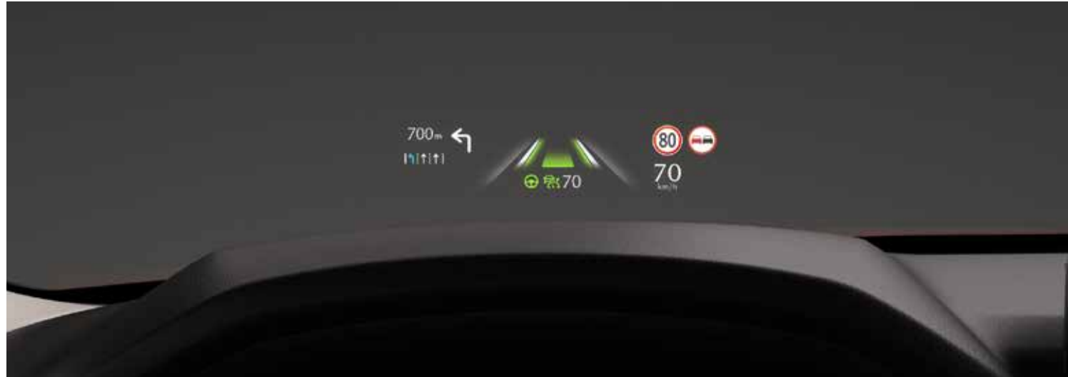
Head-up display in kleur met projectie op voorruit (ADD)