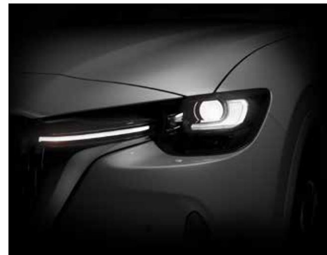
Intelligente LED-koplampen (AHL) met geïntegreerde mistlampfunctie en koplampensproeiers