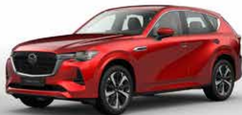
SOUL RED CRYSTAL (46V)*