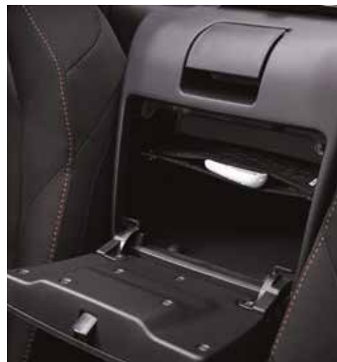
Filet d'étagère de console