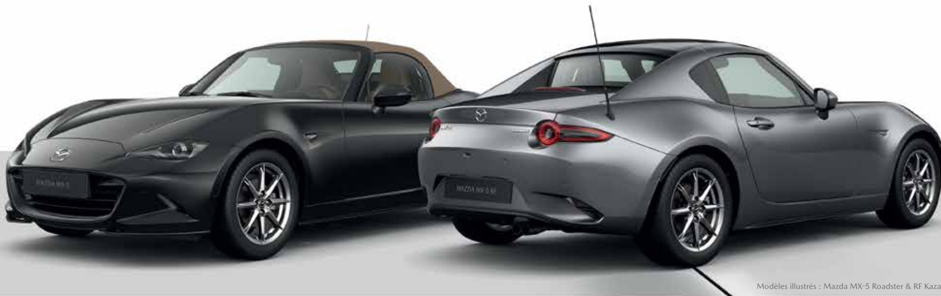
Modèles illustrés : Mazda MX-5 Roadster & RF Kazari SKYACTIV-G 132 ch