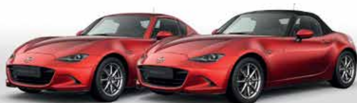
SOUL RED CRYSTAL (46V)*