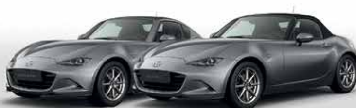
MACHINE GREY (46G)*