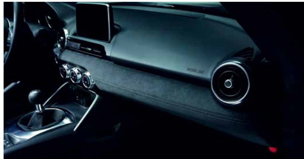
Panneau de porte inférieur, panneau du tableau de bord, soufflet du frein à main et soufflet du levier de changement de vitesses en Alcantara®