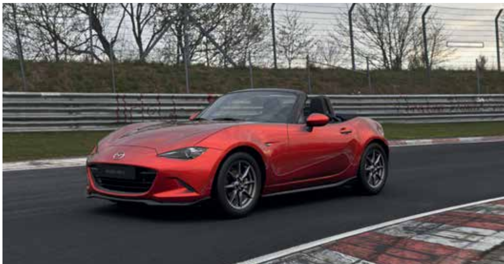
Jupes latérales, aileron de coffre, jupe avant, jupe de bouclier arrière