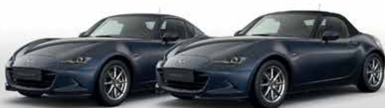
DEEP CRYSTAL BLUE (42M)*