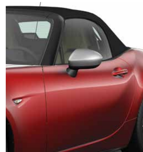
Coques de rétroviseur (argentée)